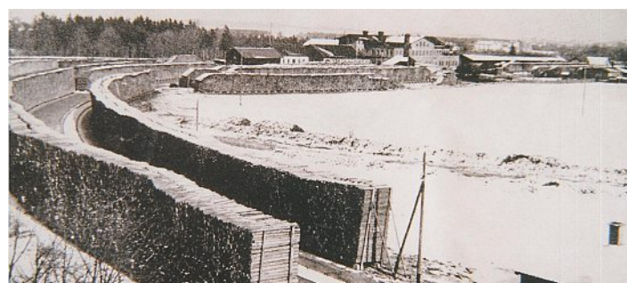
STADTARCHIV Unteres Werk und Firmengelände.

wurde, ausgedient und wurde durch Lastkraftwagen ersetzt. Bei der Schließung der Fabrik 1970 wurde das „Bockerl“ auf dem Firmengelände entdeckt, kam 1974 in den Besitz des Eisenbahnclubs München und ist heute im privaten Bayerischen Eisenbahnmuseum in Nördlingen unter dem Namen „Olching“ zu bewundern.