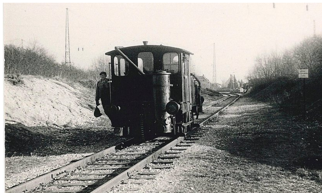
Volle Kraft voraus Ende 1950er Jahre.