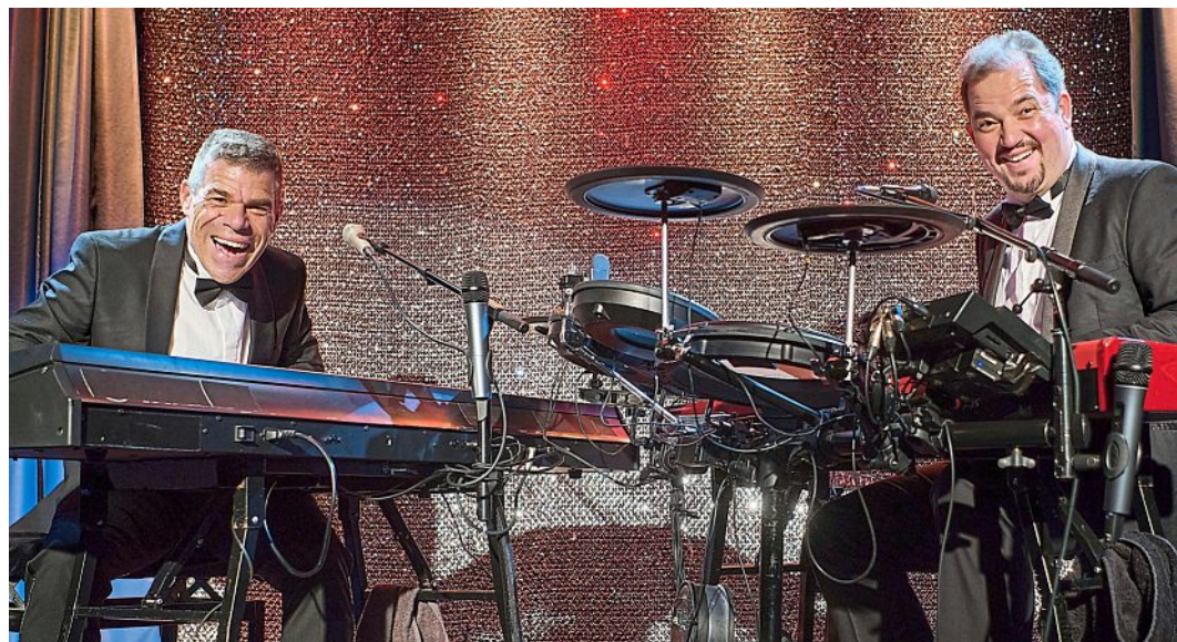
Improvisation der Extraklasse: Notenlos kommen am 18. April in's KOM.

Ein Treffpunkt für alle Olchinger und Zuagroaste, die an