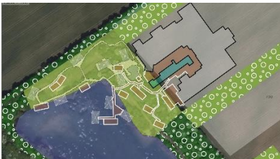
Abb. 7 großflächige Rodungen am Ufer

Insbesondere für den Bereich der Wellness-Einrichtung auf SO a und SO b wurden im Vorfeld 2019 mehrere Varianten erstellt, wobei primär auf die Einbeziehung der Uferbereiche sowie der Wasserflächen geachtet wurde.