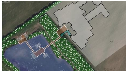
Abb. 8 nur punktuelle Rodungen und Stege Durch die Ufergehölze