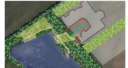
Abb. 9 kleinflächige Aufflichtungen der Ufer