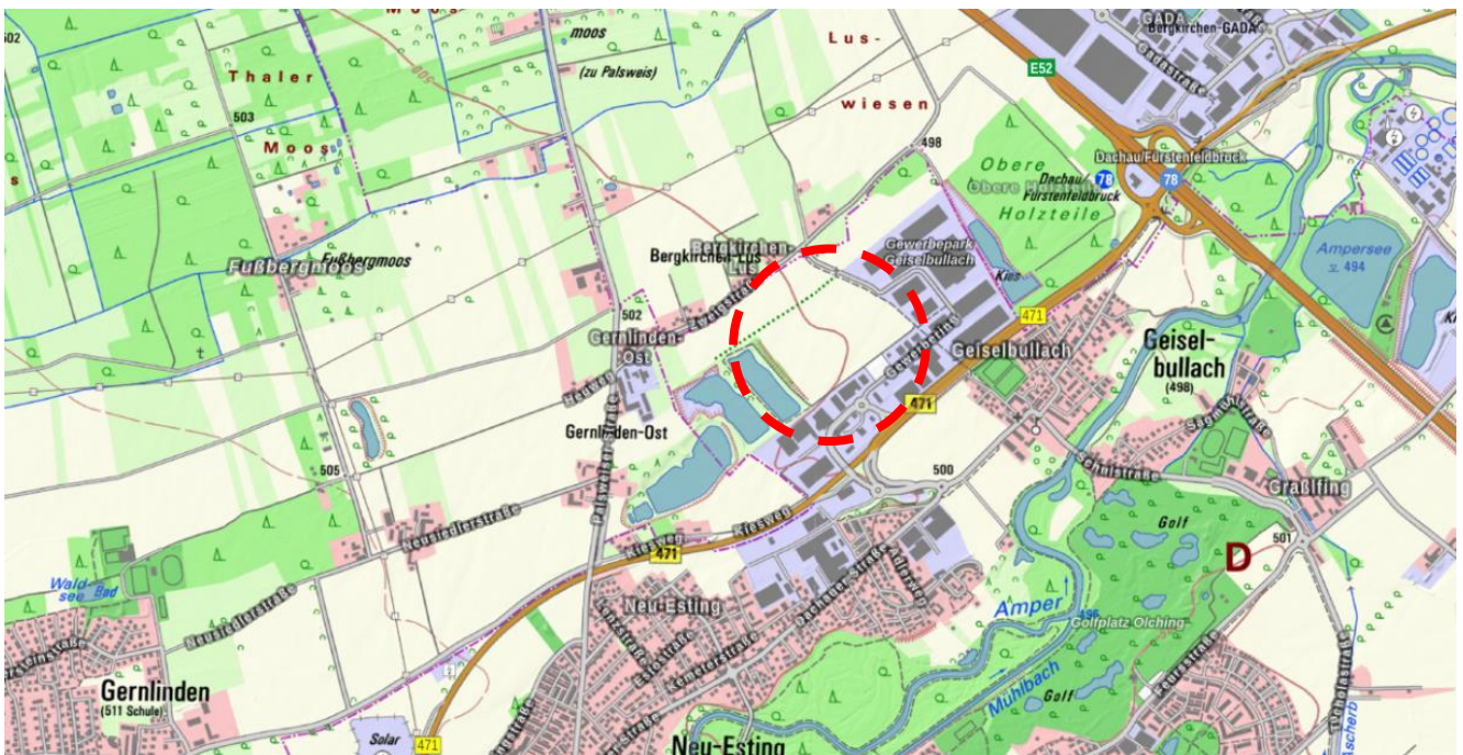
Abb. 2 Ausschnitt aus der Topographischen Karte M 1 : 50.000

In der naturräumlichen Feingliederung ist der Geltungsbereich der Untereinheit 051 Münchener Ebene zuzuordnen.