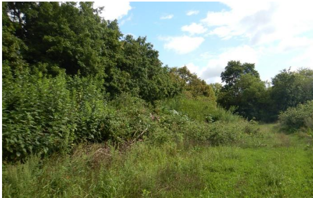
Abb. 4: Ablagerungen und nitrophiler Hochstaudenbewuchs

Die Teilabschnitte der Baum-Strauch-Hecke ergeben sich durch kleinere „Badebuchten“ und Weiherzugänge. Diese sind im Nordosten nur wenige Quadratmeter groß und neben den kiesigen Randbereichen direkt an der Wasseroberfläche überwiegend mit Gras bewachsen. Der größte Weiherzugang befindet sich am südöstlichen Rand mit einer Länge von knapp 20 m. Der dem Weiher zugewandte Streifen ist durchwegs gekiest und kaum bewachsen, vereinzelt Echter Wasserdort und Kanadische Goldrute. Im Übergang zur weiter südlich verlaufenden Baum-Strauch-Hecke befindet sich flächig ein Schilfbestand, welcher sich auch in der Gehölzstruktur fortsetzt. Die weitere Liegefläche geht in eine lückig bewachsene Kiesfläche über, welche an den Feldweg anschließt. Dieser bildet die Erschließung von Seiten des Gewerbegebietes zum Stürzer Weiher und verläuft noch weiter an der Ostseite bis ins nördliche Eck. Dort nimmt der Bewuchs des gekiesten Weges deutlich zu und geht über in eine Grünfahrt,