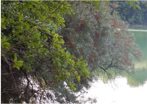
Abb. 3: Sanddorn entlang der Uferbereiche

Für das Planungsgebiet wurde bereits im Jahr 2010 und August 2019 eine Bestanderhebung durchgeführt. Die Ergebnisse der Bestandserhebung sind in der Skizze Bestandsituation M 1 : 2.000 und M 1 : 1.000 dargestellt. Im August 2019 wurde konkret der Vegetationsbestand der Osthälfte der ehemaligen Nassauskiesung auf der Fl.Nr. 100, Gemarkung Geiselbullach aufgenommen.