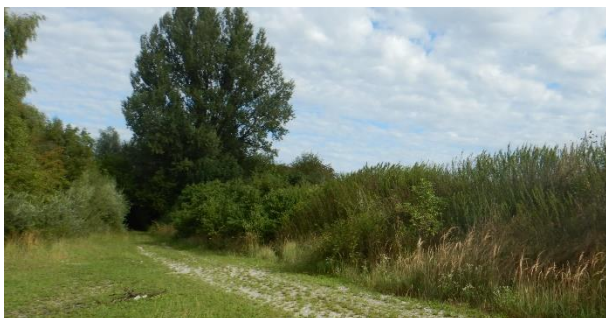
Abb. 5: raumwirksame Pappel und Böschung im Vordergrund

eine Breite von bis zu 30 m einnimmt. Die Böschung verbindet die großflächige Ackerfläche im Osten mit dem tieferliegenden Feldweg in Richtung Weiher. Im Norden geht der Damm ohne Höhenversatz in die Geländehöhe