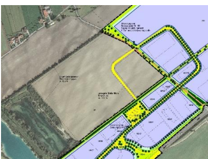
Abb. 11 Konzeption Ringschluss 31.08.2015

Bereits bei der Planung der Teilabschnitte I und II wurde eine Erweiterung des Gewerbegebiets Richtung Osten bedacht, weshalb man sich für eine „erweiterbare“ Erschließungskonzeption entschied. Diese führt bis zum Ausbau zu einem Wendehammer sowie nach Bergkirchen-Lus im Norden. Durch den Bebauungsplan Nr. 176 mit integriertem Grünordnungsplan Gewerbepark Geiselbullach an der B 471 Teil III wird nun der „Ringschluss“ vollendet und eine fließende Durchfahrt ohne Wenden wird ermöglicht. Weiterhin wird die nördlich gelegene Wohnsiedlung entlastet. Der Gewerbering schließt südöstlich des Teil III am LKW-Parkplatz an den Gewerbering an, im Nordosten kreuzt er den Kapellenweg und schließt am Gewerbering an.